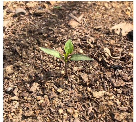
発芽した唐辛子の苗