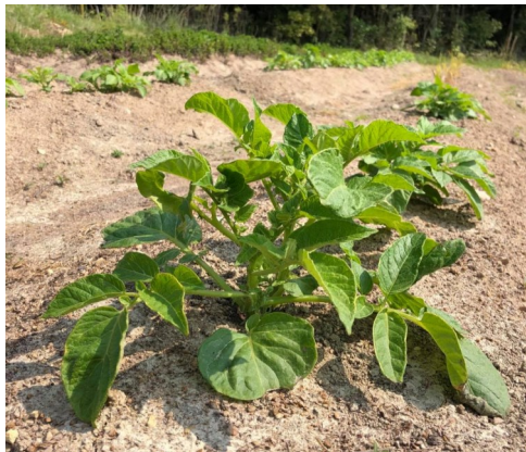
順調に育つジャガイモ

春の温暖な気候は人間だけが嬉しいのではなく、栽培している農作物も待っていましたとばかりに一気に成長します。三月六日に植え付けたジャガイモは四月上旬に発芽し、今では二十cm以上の株になっています。種イモから沢山芽がでていますが、すべての芽を成長させると、芋の数は多くなりますが、小さくなってしまうので、「芽かき」の作業を行いました。