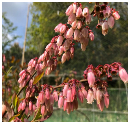
ブルーベリーの花

大変なのは、農作物と共に雑草も一気に成長しており、手を抜くと作物が見えなくなるほど覆われてしま