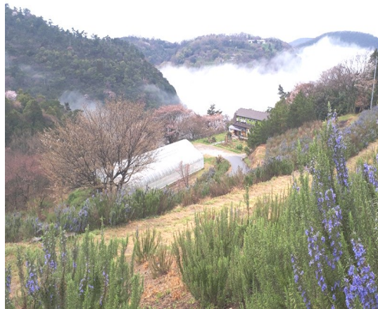
— 自然の営みの中に生かされて —

新型コロナウイルスの感染拡大の為に緊急事態宣言が発令されましたが、皆様方には如何お過ごしでしょうか。 日頃からご支援を賜りながらも何のお力添えも出来ませんことが心苦しく申し訳ありません。 慎みましてお見舞い申し上げます。 私は若輩者ですので第二次世界大戦による敗戦期の混乱を知りません。多くの方が戦場や空襲、そして原爆投下に依って亡くなり、戦災孤児や傷病者が焼け跡を彷徨していたと聞き及んでいます。 戦後の混乱期から現在の繁栄に寄