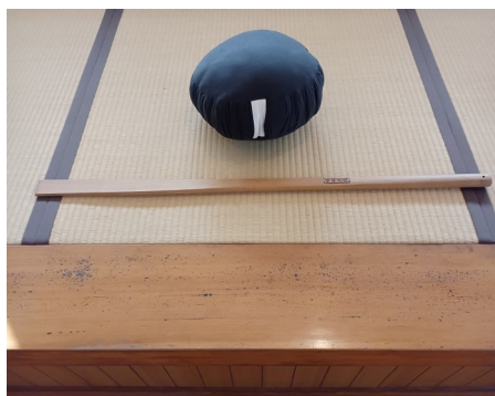
— 喝破道場の警策 —

北海道講演での留守中に高齢の禅僧が来山され、愚僧との面会を求めているとの連絡でしたので、数日不在を告げて再訪を乞うと「では帰山される迄、待たせて頂きたい」との事でしたので、その間は山内の者と同修同飯でお待ち頂きました。帰山してお会いしますと、年齢的には愚僧と変わらぬ様子ですが、眼光鋭く求道の土に窺えました。そして曰くに「師の警策を給わりたい」とのこと。