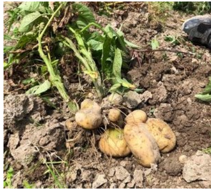
土の中からゴロゴロと

二十日、皆でじゃがいもの収穫を行いました。三月にじゃがいもの種芋を植えていましたが、順調にすくすくと育ってくれました。