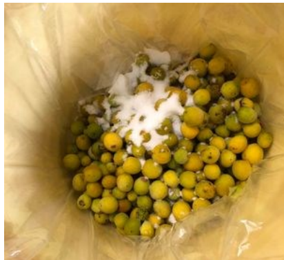
美味しく漬かりますように

一昨年は豊作で五三kgだったので1/3の量です。収穫した梅は青梅でまだ漬け込むには早いので、数日間寝かして追熟させます。青梅から黄色く色付いてきたらヘタを取り除き、良く洗って殺菌消毒します。今年は塩分18%の基本濃度で漬けこみました。