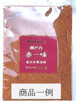
Amazonオリジナル商品としてハーブ ティーとスパイスを販売しています。 通常品より増量タイプでしかも送料無料で 大変お買い得です!! 商品一例 赤一味とうがらし30g ¥1,002 ※Amazon側より売上 状況により価格変動有

18 圓通寺「定例坐禅会」 21 若竹学園夏祭り 22 亀山学園夏祭り 26 社会福祉法人「四恩の里」施設 管理者会議 於 亀山学園