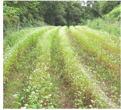
ーソバの花に蜜蜂がー