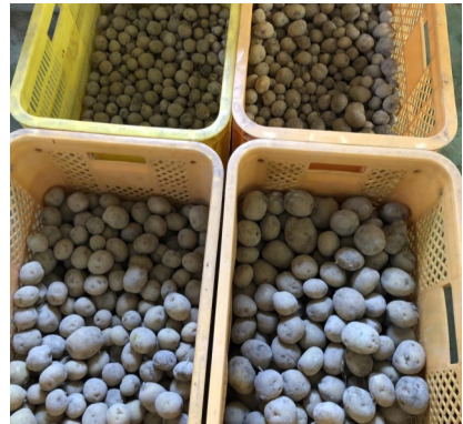
大小様々なじゃがいも