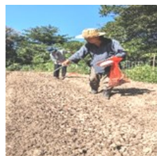
ソバの種まきと薪炊きの雑炊