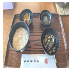
朝食と和尚様の坐禅指導