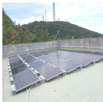
― 随流荘屋上の太陽光パネル ―

「五色台縄文ビレッジ」は自給自足を根本として、南海大地震が取り沙汰されている昨今、そのような災難時に被災に遭われた人たちの「駆け込み寺」的な役割が果たせれば、との思いもあって、仲間たちと五〇年を経過した古い建物を補修しながら受け入れ態勢を整えつつあります。