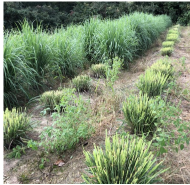
大きく育つレモングラス

今年もレモングラスの収穫時期になりました。今年は大株で元気に育ってくれています。