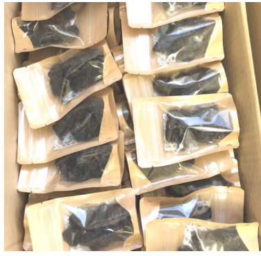
パッキングされた乾燥ブドウ

八月下旬に二軒のブドウ農家さんから乾燥ブドウ製造の依頼を受け、九月上旬に乾燥を終えました。ブドウなどの果物の乾燥は糖度が高く乾燥には苦勞します。低温で芯から温める遠赤外線乾燥機では上手に乾燥できません。温風乾燥機は表面から乾燥していくので果物の乾燥に向いています。しかし、温風乾燥機でも仕上がるのに数日時間を要します。乾燥したブドウの中でも、半熟のものも有るので一個一個確認し、半熟のブドウは再度乾燥します。