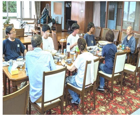
— 仲間は語って楽しい —

長引く残暑に身体を痛められたり、精神的な苦痛を感じられたりなど、さつてはいませんか。 改めまして残暑のお見舞いを申し上げます。