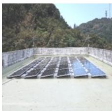
屋上のソーラー発電と景色