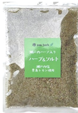
ハーブ&ソルト 80g ¥1,040

10 圓通寺「定例坐禅会」 12 福祉法人四恩の里に県の監査 21 紫雲ライオンズクラブが児童施設「若竹学園」に焼肉慰問 24 於 縄文村 圓通寺「定例坐禅会」