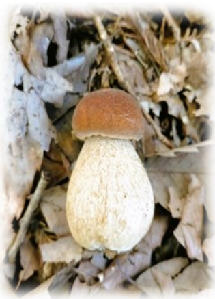
― 山野草研究家 平田勇一 ―

しかしきのこはグアニル酸とグルタミン酸の旨味成分2種類を兼ね備える物が多く美味しいのです。きのこ採りするのであればきのこ採り経験者に同行する事。スマホ検索ではとても対応できません。きのこ採り専門書の購入をおすすめいたします。きのこに絶対安全はありません。何か不安に思ったら絶対に食べてはいけません。そしてきのこは身近にあります。ポルチーニ茸(写真)なんかも簡単に採取できます。豊食の時代に自分で採って食べる最高の贅沢。