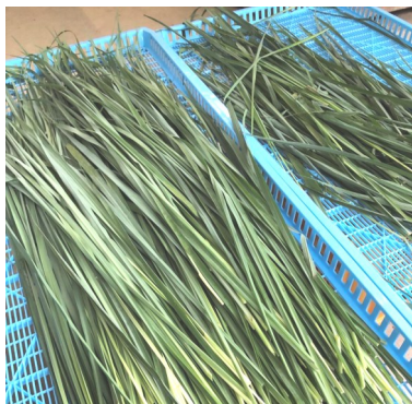
選別後のレモングラス

収穫したレモングラスは傷んでい葉や虫食いの葉を取り除きます。茎の部分は乾燥に時間がかかるので一枚一枚割いて乾燥しやすくします。その後水で汚れを洗い流し、ある程度水気が切れたら遠赤外線乾燥機を使って低温でじっくりと乾燥します。