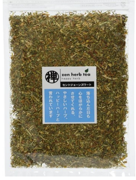
zen herb tea zen herb tea セントジョンズワート 60g ¥1,266 ※Amazon側より売上 状況により価格変動有

■精神的なケアに役立つハーブティ うつ症状の改善薬として注目されて いるセントジョンズワート。暗く沈ん だ心を明るくする働きがあります。 標準的な抗うつ薬と同等の有効性が 期待できるとされています。