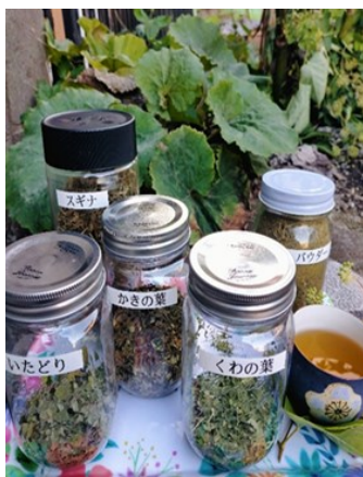
― 山野草研究家 平田勇一 ―

帰宅したら水道でよく洗います。それを天日干しします。その時はザルより魚干し用のネットがいいです。風で吹き飛ばない為。夏なら一日でカリカリに干しあがりります。それを手でパリパリにすれば完成です。あとは急須に入れて飲むだけです。その時に熱湯を入れて色が出るまで待つというのが自作野草茶のデメリットでもあります。味が美味しいのは私感になりますが柿の葉が好きです。ビタミンCも摂取できクールドでもいけます。ドクダミは癖が残るがいかにも効きそうな風味です。スギナはまつたりとした味なのですつきりしないけど利尿作用が凄いです。飲みにくい場合は二、三日様子みて合わないと思ったらやめてください。体質によりますのでそれは賢明です。