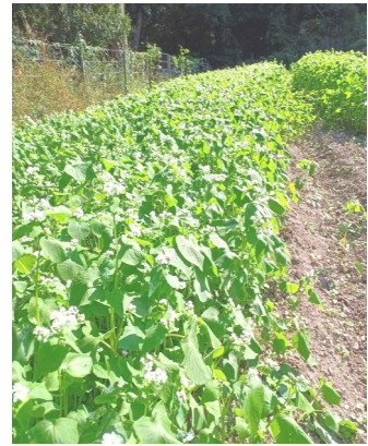
― ソバ畑 ―