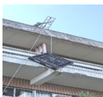
2階ベランダとテント台搬入