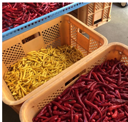
色鮮やかな唐辛子

ハーブ園では、香川本鷹と黄とうがらしを栽培しています。どちらも無農薬の自然栽培で育てています。香川本鷹は千二百株、黄とうがらしは四百株栽培し、収穫後遠赤外線乾燥して一味や七味として販売しています。