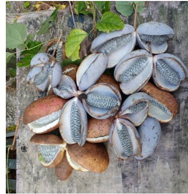
— 山野の実り「アケビ」 —

実りの秋となりました。特に今年には山野の自生植物も実りが豊かでした。私たちはスーパージ等に並ぶ野菜や果物が私たちの命を繋ぐ「食」と思ってしまうでしょうが、町から少し離れた田舎の山野には、食せる野草や山栗・渋柿・アケビなど代用食材が沢山あります。 現在は地震・大雨などの被災に依ってスーパーから食料品が消えてしまえば如何にして生き延びるか、も考えねばならない環境ではないでしょうか。 私は今春山菜で最も食しましたのは「タンポポ」でした。煮物・和え物そして汁の実など多様に使用できて美味しいのです。