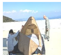
屋上に来客宿泊のテント設置