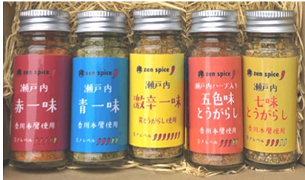
① ② ③ ④ ⑤

①赤一味 ②青一味 ③激辛一味 ④五色味とうがらし ⑤七味とうがらし 各540円(税込)