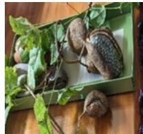
畑のソバの成長と山のアケビ