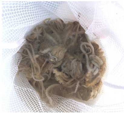
手のひらサイズのイイダコ

1.6トン)と一〇〇分の一に激減しています。今年から香川県は遊漁船の業者や個人の釣り客に対し、イイダコ釣りの期間を九月一日から十月十五日までの午前中に制限し、釣れた量を報告するよう協力を呼び掛けています。七日は釣れない覚悟で今年最初で最後のイイダコ釣りとなりましたが、多くの船が旬のイイダコを求めて集まっていました。やはり他船もあまり釣れてなさそうでした。十二時まで制限時間いっぱい釣りをして全員で計二十五匹と何とか釣れました。