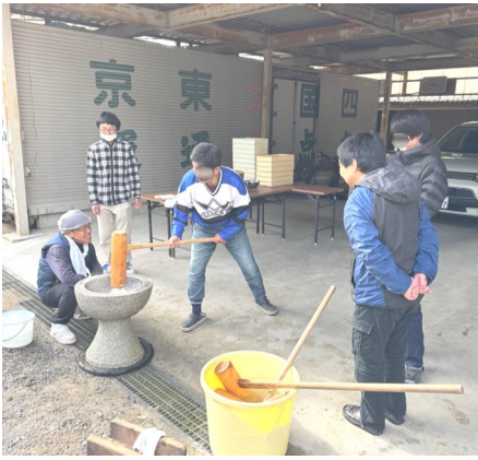
沢山餅を搗きました

二十日は恒例の餅つきを行いました。小学三年生以来と言う塾生や、初めての塾生がいる中で、餅米十五kg分を搗きました。始めはへっぴり腰だった塾生も、終盤には力強く搗けるようになりました。