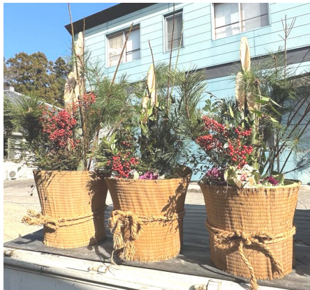
立派な門松が完成

二十五日は、鏡餅作りと門松作りを行いました。塾生の皆は初めての経験で、まさか門松を手作りするとは思ってもよらなかったと言っています。材料さえ揃えば簡単にできる鏡餅と門松です。各々の感性で個性豊かな門松が完成しました。