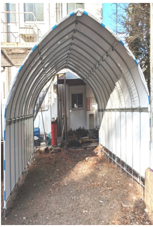
— 薪用ビニールハウス —

慎みまして新年令和七年新春のお慶びを申し上げますと共に、皆さま各家ご家族様にとってより良い一年でありますことを祈念申し上げます。 また令和縄文村の今年は地を這う蛇の如く「精進」の意味する「精とは混じわさる也、進とは退かざる也」を心に秘めて村創りに取り組んで参ります。 昨年末に念願でした「薪小屋」のビニールハウスが完成しましたので、先に購入していましたコンボ機を活用して薪造りに励みます。