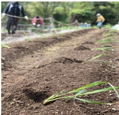
元気に育ちますように

ビニールハウスで育てていたレモングラスが枯れることなく越冬しました。今年は株分で育てます。