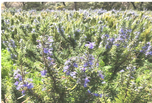
— 青紫色の花を咲かせるローズマリー —