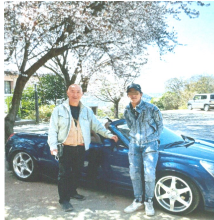
— 在園6年 笑顔で語る —