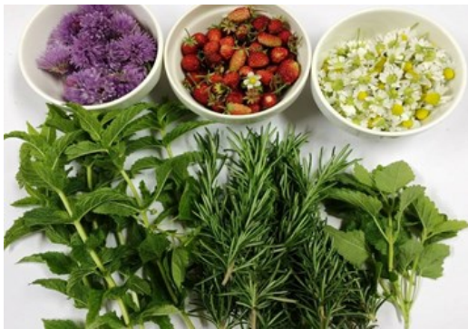
— 今が旬 ハーブ園のハーブ達 —