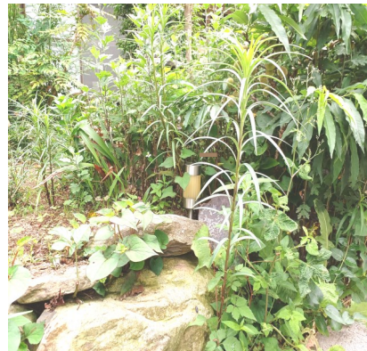
— 路傍の高級食材 ユリ・ミツバ —

暑中のお見舞いを申し上げます。有り触れたご挨拶ですが、現実には一昨年からのコロナも終息には至らず全世界が見えないコロナと攻防を繰り返しています。第三次世界大戦の火種とも成り得るロシアによるウクライナ侵攻は自由主義圏と共産主義圏との代理戦争の様相を呈していて、この戦争では誰も勝者にはなれず、共に疲弊して各国国民が悲嘆を強いられるのみでしょう。 国内にあつては今も継続している各地での突発的な地震と大雨での人的・物的被害は甚大です。重ねて戦争に伴って食材や産業資材などが輸入を妨げられて物価が高騰しています。