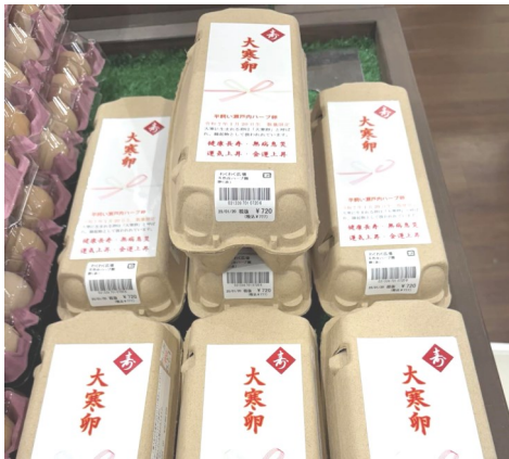
大寒卵の限定販売

ハーブ園にも大寒卵の販売の問い合わせが多かった為、今年は少量ですが数量限定で販売してみました。が、思いのほか大反響で即完売でした。