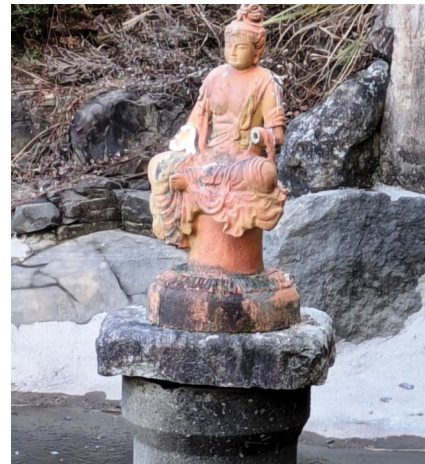
— カツパ池の観音菩薩 —

今年に入って正月が過ぎた頃の寒かった日の午後、道場のカツパ池には厚さ約5〜6センチの氷が張っていました。 道場横の学園生徒が見逃すはずもなく、授業もなく暇を持て余していた子供たちは我先にと飛び出してきて、池の周囲の石を剥して厚く張った氷を割ろうとするのですが割れないのです。 年長の悪ガキの指示で土手沿いに置かれている大きな石を二人がかりで運んで来て、高いところから「よいしょ!」と投げ入れるのですが、厚い氷は割れずに氷の表面を滑っていきます。 子供たちにとってはその石が滑つ