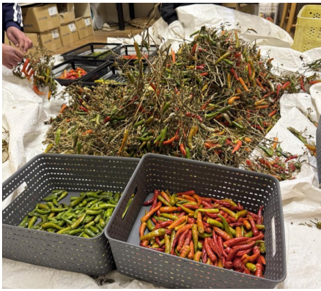
唐辛子の仕分け作業

昨年六月から育てていた香川本鷹唐辛子の最終の収穫を行いました。本来ですと昨年未までに終わらしたかった収穫作業ですが、年末はバタバタで一月中旬になってしまいました。唐辛子は一月に入っても収穫できませんが、霜にあたると実が傷んで腐ってしまいます。その為、寒波がくる前に全て収穫しなくてはなりません。株元から切り取り室内で収穫と赤唐辛子と青唐辛子の仕分けを行います。