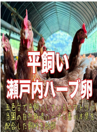
五色台で平飼いのニワトリは、自然栽培のハーブと香川本鷹唐辛子を配合した飼料を給餌 20個入1,080円 (送料別途60円/箱) 関東700円・近畿650円・香川620円

一般的なケージではなく、鶏舎内を自由に伸び伸びと動き回ることに育ち健康でストレスのないニワトリに育ちました。そんなニワトリ達が産んだ卵の黄身は濃厚で、弾力抜群の白身が特徴です。卵特有の臭いも軽減した美味しい卵を是非この機会にご賞味下さい。