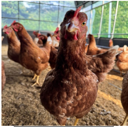
1歳頃のニワトリさん

現在飼育しているニワトリ五百羽は昨年五月二十三日に迎え入れ、六月中旬に産卵が始まり、今年一月二十三日で1歳になりました。