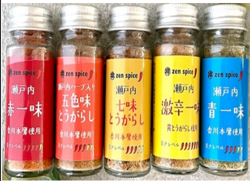
①②③④⑤ 各540円(税込) 内容量 ②13g ①③④⑤15g