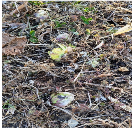
— ニョキニョキ落の臺 —

弥生三月、人の目に触れぬ道端や小川の岸辺に根を養いながらじつと自分の出番を待っていた草木が時宜を得て、恰も突然のように姿を現します。 しかし今年の過酷な寒さを生き延び、力を蓄えて自分に課せられた任務を果たそうとしている姿に愛おしさすら感じます。 世の中ですべてが順調、と言う時こそ慎重が必要です。 その失敗が行動を慎重にして軌道修正してくれます。 昨年の令和縄文村では様々な方が村民希望で訪れましたが、訪れる方の縄文村に対する先入観が強すぎて、現実の縄文村と相容れなく退村