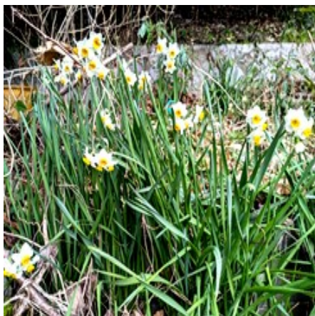
— 春到来を告げる水仙 —