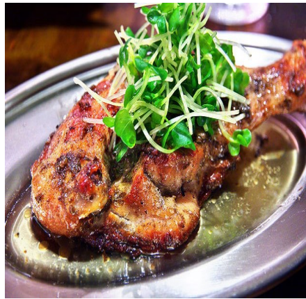
香川県名物「骨付鳥 おや」

採卵養鶏では通常、産卵開始からおよそ一年半〜二年後に徐々に卵を産まなくなったり、卵の質を落としたりしてしまいます。養鶏場では質が良い卵を効率よく生産するためにその時期になると入れ替えをします。卵を産まなくなったニワトリは「廃鶏」と呼ばれ、食肉になります。廃鶏は肉用鶏と比べて肉質が固いため、加工肉や冷凍肉、レトルト