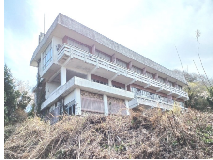
— 縄文村の拠点「随流荘」 —

現在七十七才の私の余命は長くはないのですが、多くの方々から託せられた土地と建物があります。