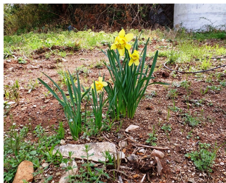
— 生き抜く力を給わりたい —

いませんでしたが、心電図その他の計測器が上半身に貼り付けてあり、看護師さん一人が付き添って来ていました。