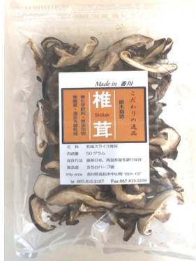
スライス 463円(税込) 内容量50g