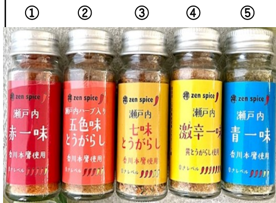
①②③④⑤ 各540円(税込) 内容量 ②13g ①③④⑤15g