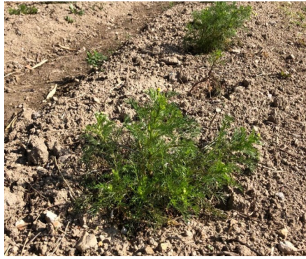
元気に育つカモミール

カモミールは約300苗をハーブ園と後夜谷農場に植え付けしました。早くも花を咲かせている苗もありますが、四月後半から花の収穫が忙しくなります。カモミールの収穫は梅雨の長雨で枯れてしまいますので六月中旬まで収穫は続きます。