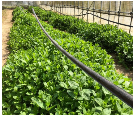
たっぷり水を与える

また、ビニールハウスで育てているミントは今まで人力で水やりを行っていましたが、夏場は水不足で枯れてしまったミントもあります。どうにかならないかとスタッフでアイデアを出し合い、この度、DIYで自動散水機が完成しました。