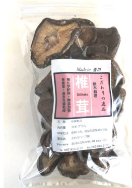
ホール 823円(税込) 内容量100g

自然豊かな環境で原木栽培した肉厚の椎茸を乾燥させました。濃厚な旨味と芳醇な香りは格別です。いづれ食べてみて下さい。