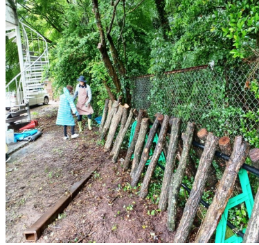
— 雨中のシイタケ本伏せ作業 —