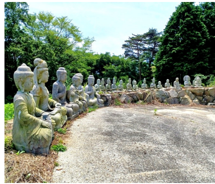
— 諸仏諸尊ご降臨 —

愈々全国的に梅雨入りの時節となりましたが、皆様にはお変わりありませんでしょうか。