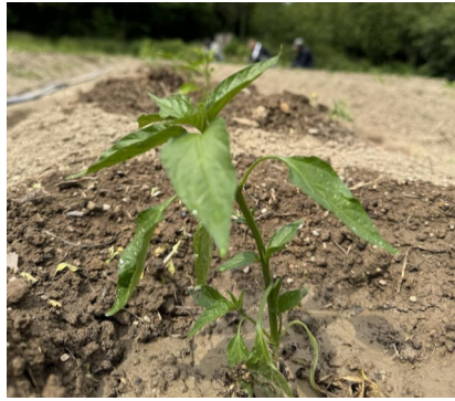
すくすく育つ唐辛子

四日と五日に香川本鷹の植え付け作業を行いました。本来は五月中旬に植え付けを行う予定でしたが、ニワトリの受け入れ準備や雨の影響で遅れ遅れになっておりました。