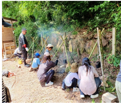
— 児童養護施設の子供たち —

これも毎年「手前みそ」を皆で作ろう、と言うことで、大豆の種まきからの味噌造りは少ないでしょうが縄文村のような共同体なら可能ですね。今年秋は昨秋に出来なかつた、太陽の光を全身に吸って落ちた落葉樹の葉を集め、畑の堆肥作りがしたいのです。