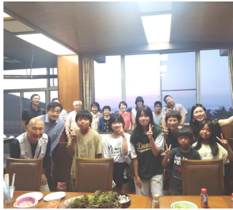
— 花火の集合写真 —