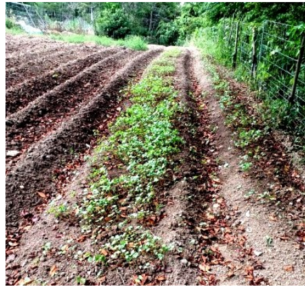
— 雨のない中で順調に育つ蕎麦 —