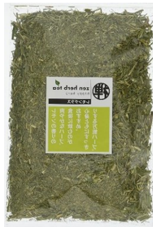
レモングラス 60g ¥1,620