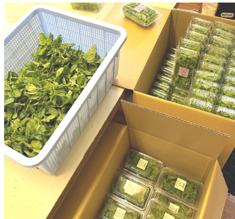
パックに詰めます

先月の記事にはミントの事を掲載致しましたが、今回もミントなどのフレッシュハーブについてです。フレッシュハーブの注文はお盆がピークになります。高松市と丸亀市の市場からの注文や高松市内の八百屋さん、BARからの注文が殺到します。この時期に注文が多いのはミントとバジルです。どちらも夏にはピッタリのハーブで暑い夏を癒してくれます。