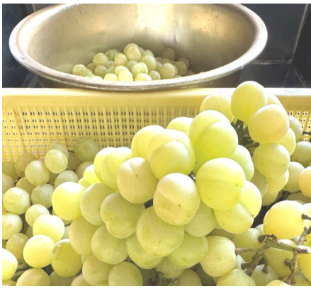
美味しそうなブドウ

香川県のブドウ農家さんから「シャインマスカット」と「瀬戸ジャイアンツ」を乾燥してレーズンに仕上げたいとの依頼です。ハーブ園には収穫したハーブを乾燥する遠赤外線乾燥機と温風乾燥機があります。乾燥機はハーブ以外にも唐辛子や椎茸を乾燥してきました。数年前からマンゴーやキウイフルーツ、ブドウ、柿などの果物を乾燥して欲しいとの問い合わせがあり、加工委託を受けています。香川県のブドウ農家さんは今年で三年連続の依頼です。