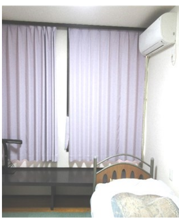
— 冷暖房完備の個室 —

「禅」を心の依り拠として ○規則正しい生活リズムの体得。 ○自給自足の農作業を通して「体力・気力・忍耐力・持続力・協調性」を涵養。 詳しくは電話にてお問い合わせ下さい。 (087-882-4022)