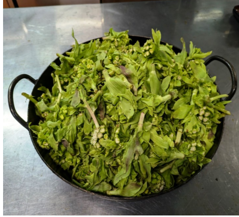
— 大鍋に収穫した 1kgの蔕の薑 —

福を念じている、と言われたのです。農家の方が言われたように、お釈迦様のお弟子さんは沢山おられたので、皆で畑を耕して食料を作ることが可能ですが、あらゆる存在に命が宿っているのので育った野菜などを食すると言う事は野菜の命を奪うことだ、と言うアニミズムが根本でしたので食糧として育てることはしなかつたのです。