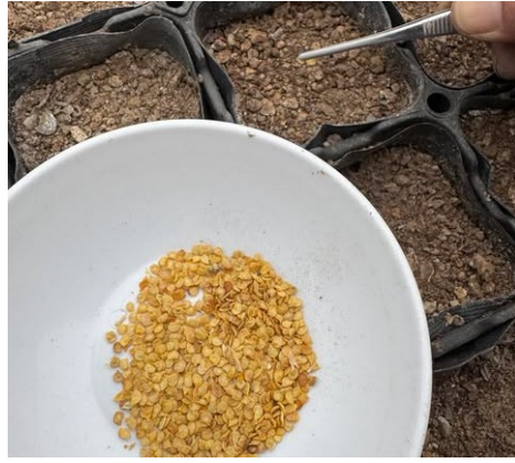
小さな種を丁寧に蒔く

四日から七日にかけて唐辛子の種まきを行いました。 昨年育てていた香川本鷹唐辛子と黄とうがらしを乾燥して、形が良く、大ぶりの唐辛子から種取りをして、育苗ポットに種を蒔きました。