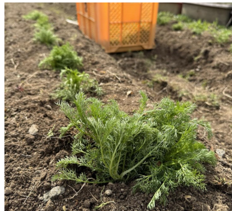
人参の葉に似たカモミール

カモミールなのか雑草なのか一見分かりません。初めて見る塾生には区別がとて難しく、間違えて雑草を植えてしまったって事はよくあります。