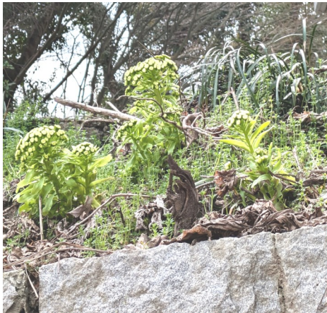
— 取り残した蔕の薑 —

調理法を懇意な地元の博学主婦に教わり、蔕の薑の採取に入りましたが、採取の仕方は秋のキノコ採りに共通して、他に気を取られて足元の蔕の薑を踏んずけてしまわないこと。数度少量から採取して調理してみました。